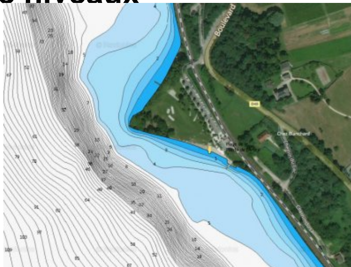
Courbes bathymétriques - Site de la pointe de l'Ardre