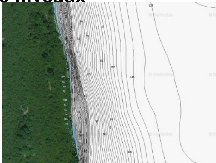
Courbes bathymétriques - site de Barmetta

Le bas du tombant à la vase est à 107 mètres.