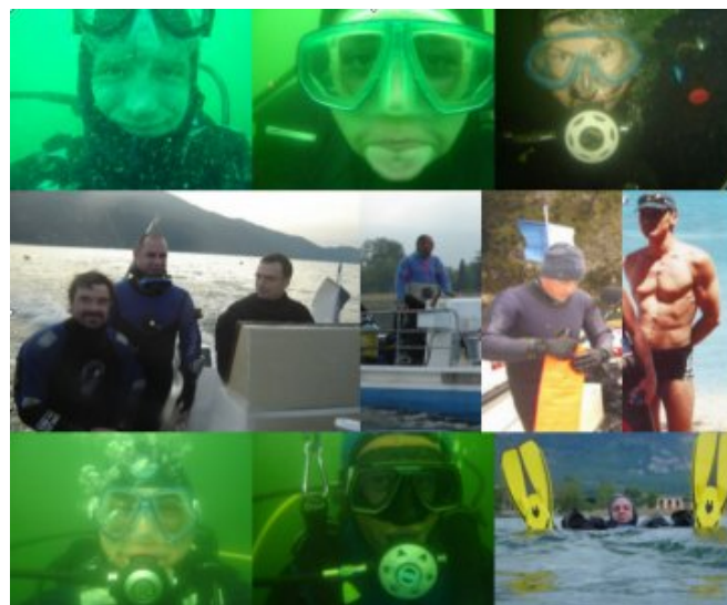
Nouveau cru N2 2005 et ses tortionnaires

Et maintenant, la conclusion, le bouquet final, la der des der, la fin de formation niveau 2 2005.