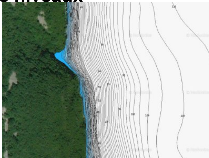
Courbes bathymétriques - site du chemin du curé

Le bas du tombant à la vase est à 78 mètres.