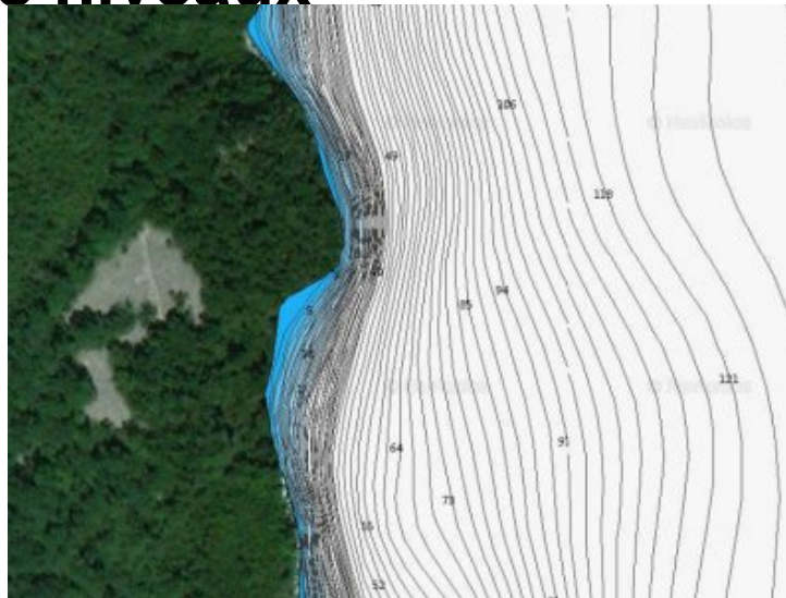
Courbes bathymétriques - site de la grande cale

Le bas du tombant à la vase est à 93 mètres.