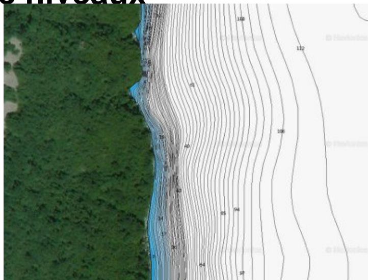
Courbes bathymétriques - site de sous les Rottes

Le bas du tombant à la vase est à 88 mètres