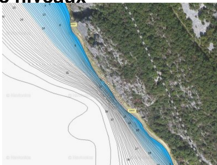
Courbes bathymétriques - site de la vieille route

Le bas du tombant à la vase est à 35 mètres.