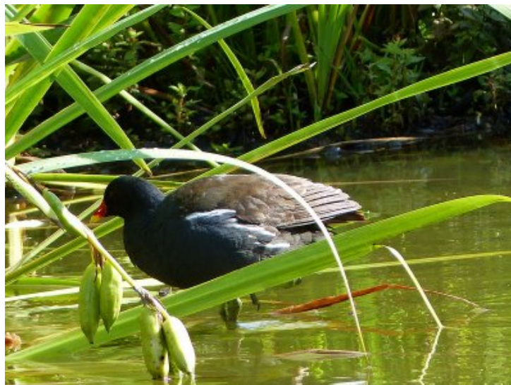
La poule d'eau